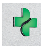
M3 flach an Wand