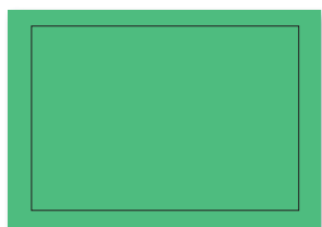
2/1 Seite (Panorama)